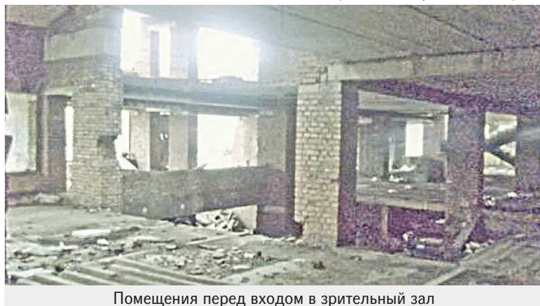
Помещения перед входом в зрительный зал