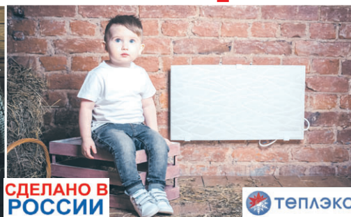
СДЕЛАНО В РОССИИ ТЕПЛЕКО