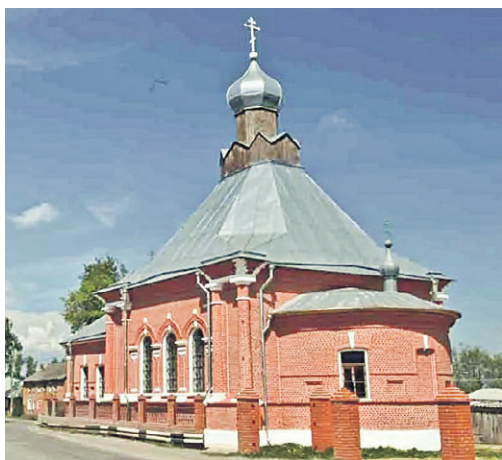
Крестовоздвиженский Белевский монастырь

В 1888 году крупный промышленник и купец Амвросий Прохоров открыл в городе производство слоеной белевской («прохоровской») пастилы. И в какой-то мо-