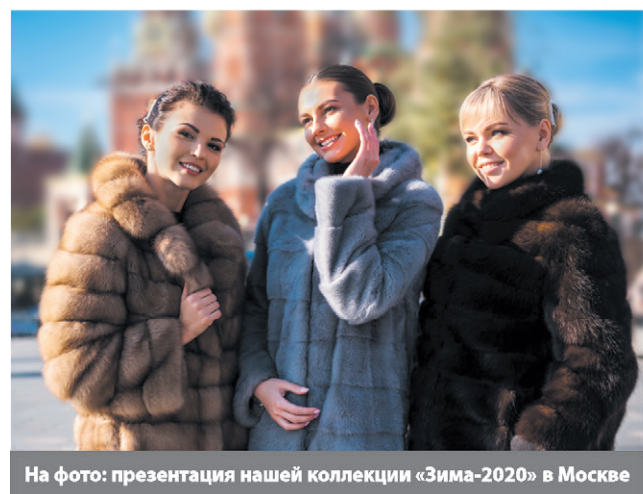
На фото: презентация нашей коллекции «Зима-2020» в Москве

Выставка от ведущих фабрик из Кирова и Пятигорска приглашает на последнюю распродажу в Вашем городе! Вы спросите, почему мы распродаем весь ассортимент практически по себестоимости? С удовольствием расскажем: