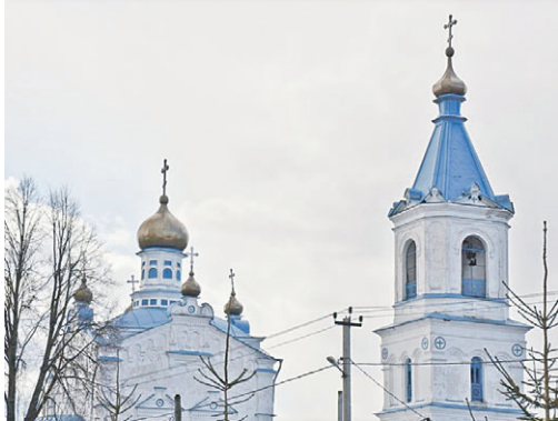
Церковь Николая Чудотворца

мент ее изготовлением стали заниматься все, как говорится, кому не лень. В редком доме с приусадебным садом хозяйка не делала пастилы.