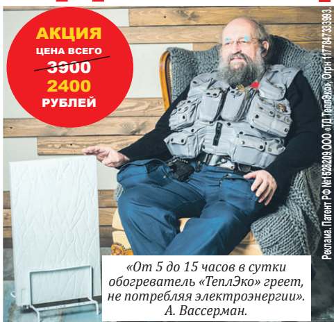
«От 5 до 15 часов в сутки обогреватель «ТеплЭко» греет, не потребляя электроэнергию». А. Вассерман.

Во многих квартирах батареи то греют, то не греют. Если в мае квартирную «печку» можно отключить, в сентябре ее не включишь, так как отопительный сезон еще не начался. А еще иногда батареи засоряются... А еще падает давление в системе... А еще... Да мало ли отговорок мы слышали о том, почему в квартире вдруг становится холодно. Послушав о причинах похолодания, мы доставим обогреватели, какие у кого есть: масляные, тепловентиляторы, калориферы. Одни сушат воздух, другие угрожают пожаром, к третьим нельзя подпускать детей. В общем, мороки с ними не меньше, чем с громадной русской печью. При этом они еще крайне «прожорливы»: счет за электроэнергию