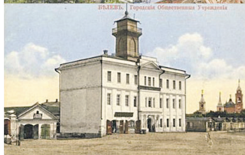
Белев на старых открытках