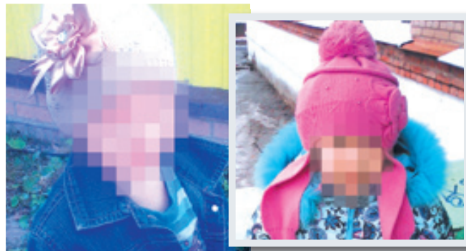
Кристине (на фото слева) было три года, Вике (на фото справа) - семь лет.

- Буквально через 10 минут, как я ушла из дома, мне позвонила мама и прокричала в трубку: «Дочь, мы горим», - рассказывает