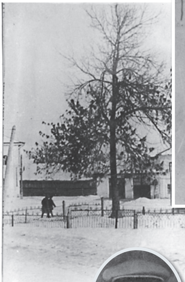
Слева: Памятник Александру Чекалину, расположенный на его родине - в селе Песковитское Суворовского района.