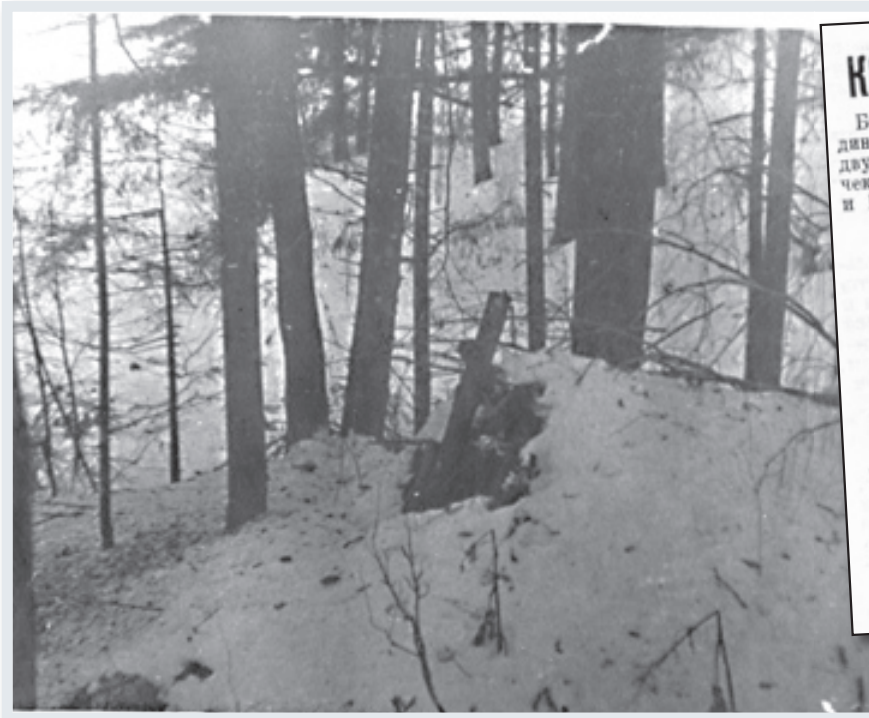
Землянка партизанского отряда «Передовой».

2 сентября 1941 года в Тульской области было принято решение о формировании партизанско-