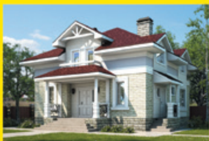
«Сварог» 10,7x11,0 м (каркас) – 2 172 540 руб. 1 738 830 руб. «Сварог БК-140» 10,7x11,0 м (кл. брус) – 2 537 770 руб. 2 121 200 руб.