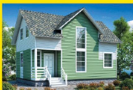
«Феникс 2 К» 6,0x6,0 м (каркас) – 958 880 руб. 699 880 руб. «Феникс 2 Б» 6,0x6,0 м (кл. брус) – 1 058 880 руб. 888 000 руб.