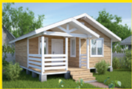
Баня в земной комплектации по цене от 165 700 руб.

www.zod.ru (4872) 57-03-03 ул. Октябрьская, 162