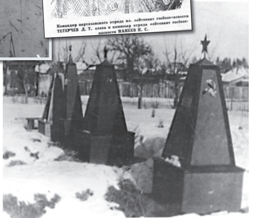
Внизу: Могилы партизан «Передового», расположенные в сквере в городе Чекалин.

Этого количества должно было хватить на полное разрушение железнодорожных путей. В условиях отступления у фашистов не оставалось бы времени на восстановительные работы, следовательно, все составы, вагоны, паровозы достались бы наступающей Красной Армии. Привести в действие взрывчатку решили с помощью гранаты. Отправив бойцов в укрытие, коман-