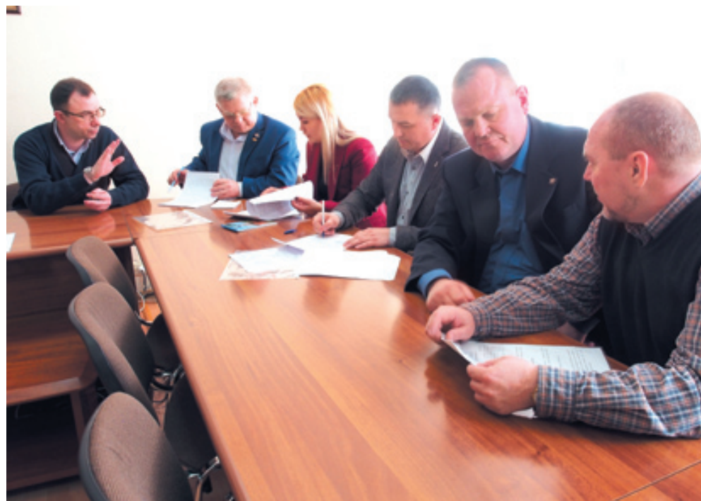
Перевозчики подкрепили своими подписями намерение работать открыто, прозрачно, с соблюдением действующего законодательства.