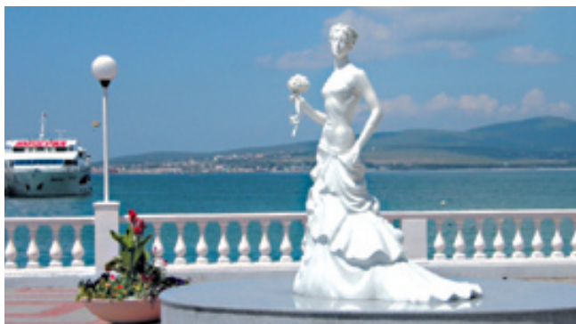
Скульптура «Белая невеста» - символ Геленджика

в Европе - «Золотая Бухта». В Геленджике созданы дельфинарий, океанариум и два горных парка: Сафари-парк, где можно увидеть диких животных, и парк «Олимп» с киноконцертным залом, откуда можно подняться на поверхность Маркохтского хребта и насладиться красотами панорамы Геленджикской бухты и окрестностей. Также на вершине хребта гостей города ждут