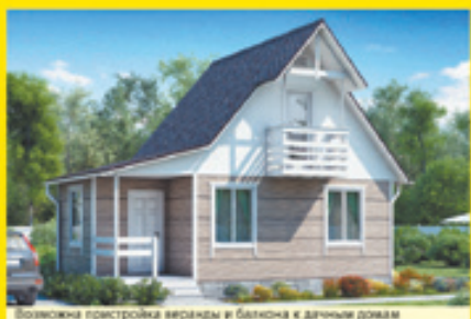
«Престиж К-150» 6,0x5,0 м (каркас) – 375 000 руб. 291 320 руб. «Престиж Б-100» 6,0x5,0 м (кл. брус) – 435 430 руб. 349 170 руб. «Престиж Б-150» 6,0x5,0 м (кл. брус) – 509 170 руб. 408 300 руб.