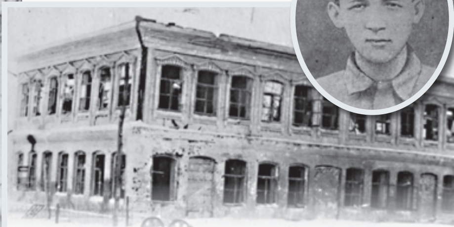
Школа, где учился Александр Чекалин. Она работает и в наши дни в городе Чекалин Суворовского района. Учебное заведение названо в честь героя - МБОУ «Чекалинская СОШ им. А. П. Чекалина».