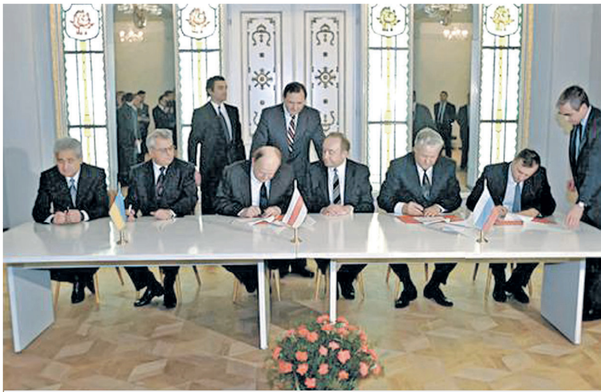
Подписание соглашения о ликвидации СССР и создании СНГ

провести модернизацию страны. Потому что Россия в силу суровости климата и дальности расстояний в своем развитии всегда потихоньку отставала от окружающих стран. И когда этот отрыв становился критическим настолько, что мы могли исчезнуть как государство и рассеяться как народ, возникала необходимость в рывке.