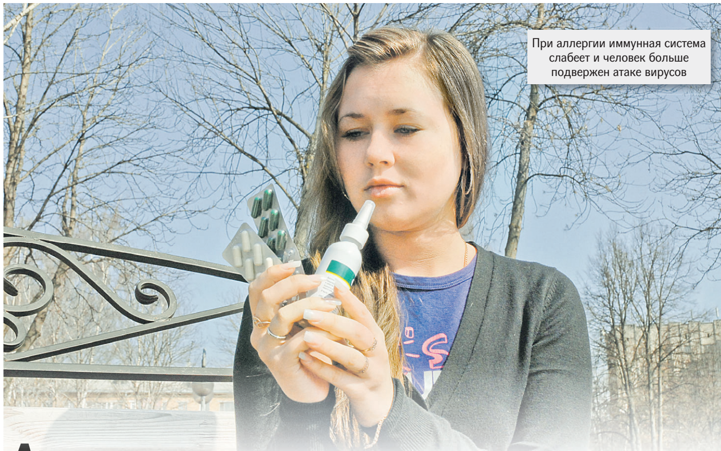
При аллергии иммунная система слабеет и человек больше подвержен атаке вирусов