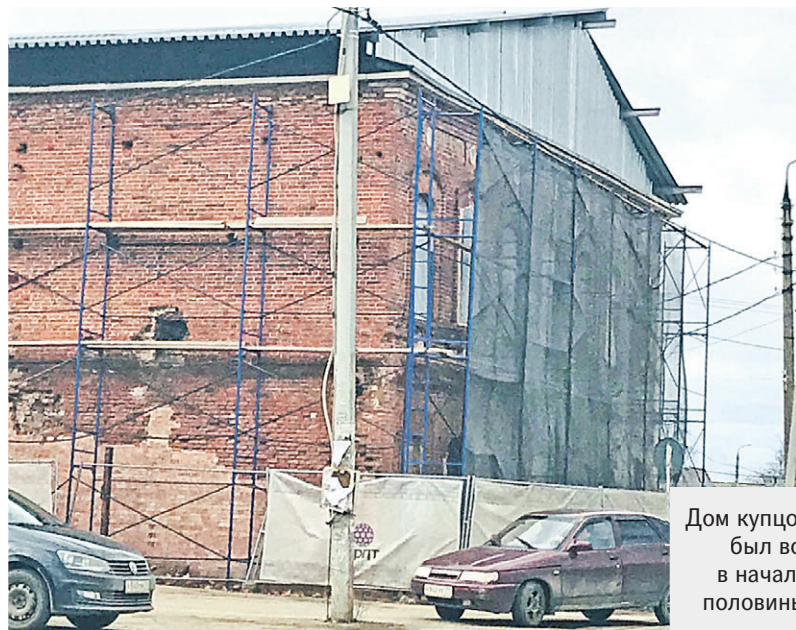
Дом купцов Пучковых был возведен в начале второй половины XIX века