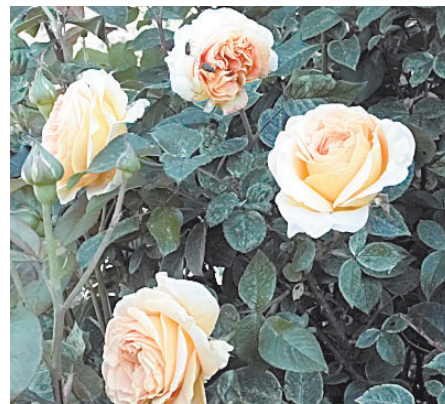
В жару розы особенно нуждаются в защите от вредителей