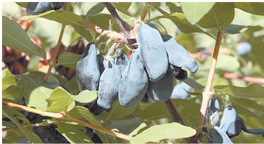
Жимолость плодоносит уже в мае