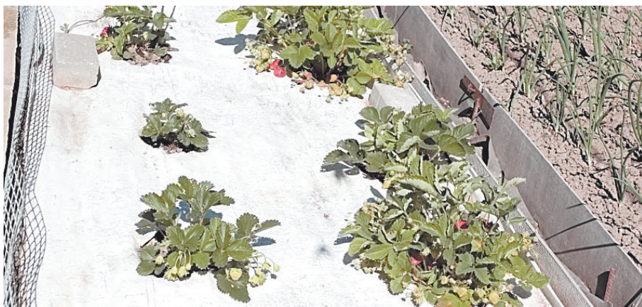
Клубника под специальным плотным материалом дает богатый урожай