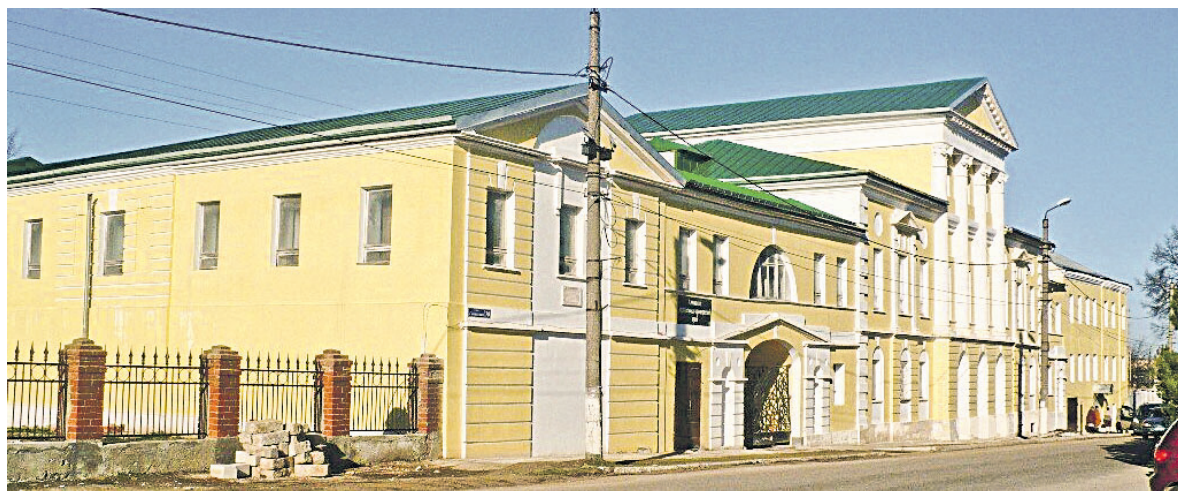
В особняке Масловых, как в лучшем доме Алексина, устраивались приемы проезжавших через город именитых гостей и титулованных особ.

Здание было возведено в начале второй половины XIX века. Это один из ценнейших памятников архитектуры и градостроительства своего времени. Интерес для историков представляет практически все — кирпичная кладка, устройство стен, перекрытий, окон и оконных проемов, подвальных помещений, фундамента. Это одно из двухэтажных строений, чудом