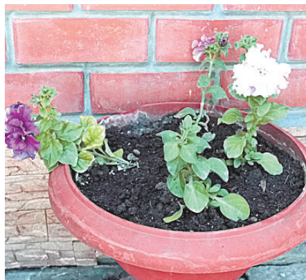
Петунию можно проращивать в стаканчиках из-под сметаны